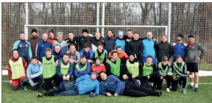
Foto k čl. na str. 4, „Ohlédnutí za prvními zimními měsíci - TJ Sokol Příkazy“