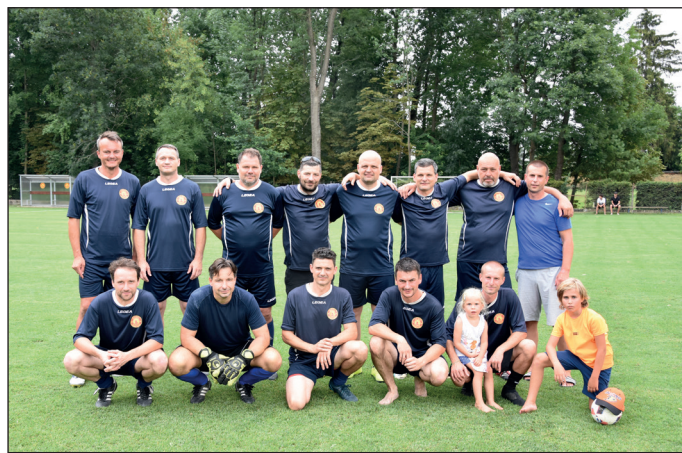
Olstroj cup 2022, - 23.7.2022