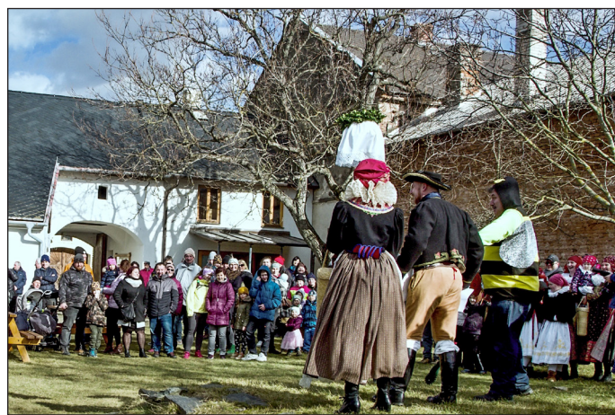
Ostatky v Příkazích 19. února 2022