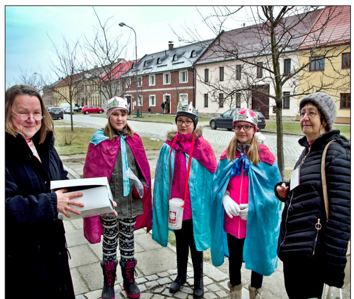
K článku Tříkrálová sbírka