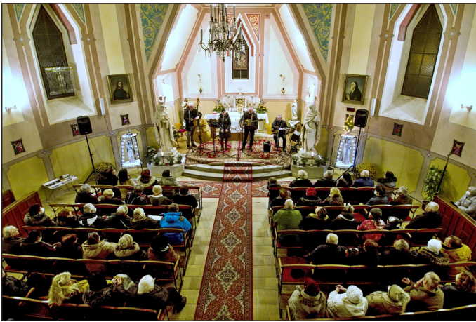
Tříkrálový koncert 7. ledna 2022