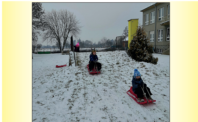
Hurá na sněhu ve mateřské školce