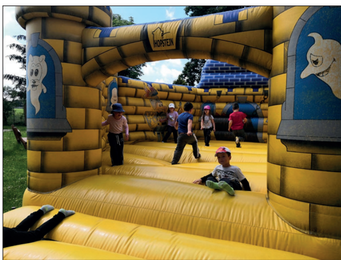
Děti opět ve školce