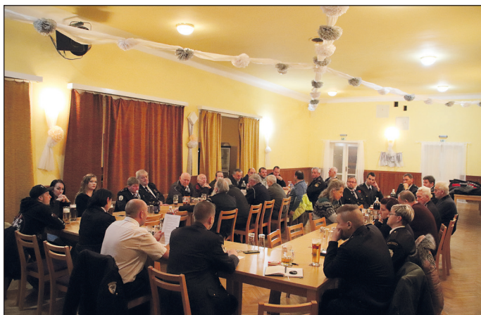
Foto k článku na straně 11 - Výroční valná hromada SDH Hynkov