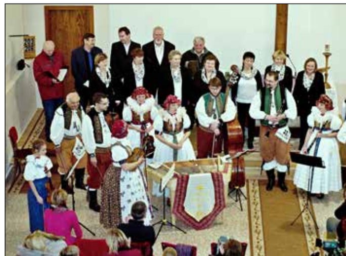
Foto k článku na straně 4 - Smíšený pěvecký sbor v roce 2019, vystoupení 14.12.2019 v Litovli, v Husově sboru s Hanáckó Mozekó