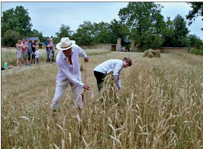
Foto k článku na str. 8. Sklizeň obilí v Hanáckém muzeu v přírodě ve skanzenu v Příkazích