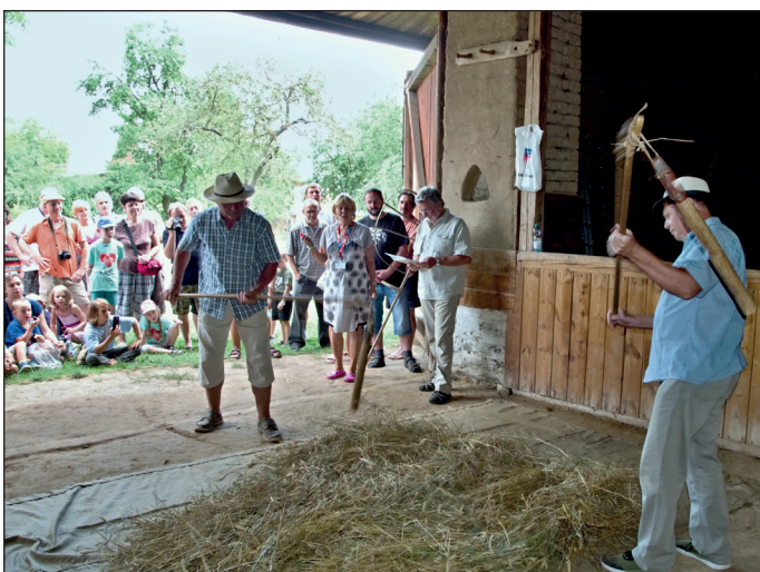
Foto k článku na str. 8. Vémlat obilí v hanáckym muzeu v přírodě - v našem skanzenô