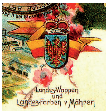
Zemské barvy a znak Moravy, 1900

Nový impuls k rozšíření přišel po uvolnění poměrů po roce 1989. Tradiční žlutočervené moravské vlajky začaly být opatřovány zemským znakem - šachovanou orlicí v modrém poli, a to z důvodu odlišení od jiných podobných vlajek. Tato varianta si pro svoji srozumitelnost i estetickou úroveň získala velmi rychle oblibu po celé Moravě a stala se základní a všeobecně uznávanou podobou moravské vlajky současnosti.