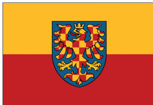
Současná podoba moravské vlajky

Zpracovala Moravská národní obec, z. s.: http://zamoravu.eu/