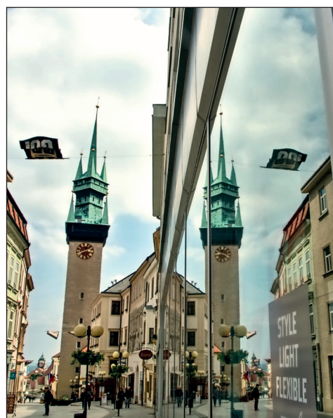
Znojmo, vidím tě dvojmo . . . .