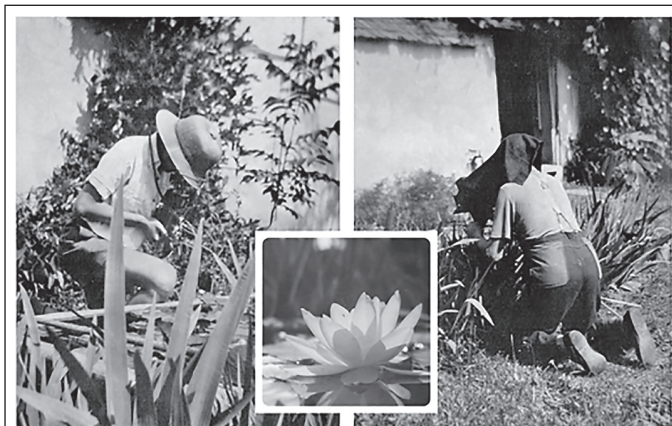
Fotografujeme leknín u Svozila někdy v r.1959