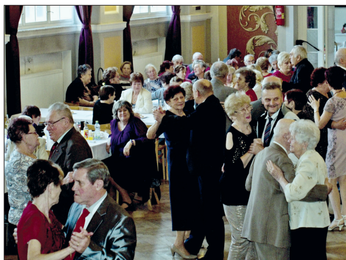
Ples Seniorského klubu