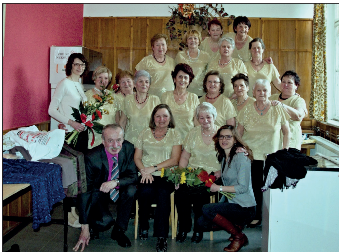
Chvilka po vystoupení s autorkami kreace