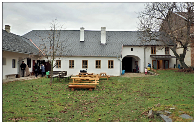
Do skanzenu přichází jaro . . . , foto k čl. na str. 5 - Vážení obyvatelé Příkaz a Hynkova