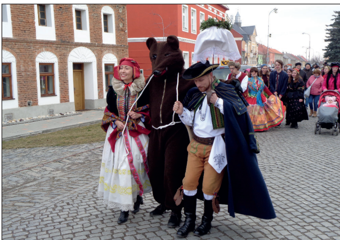
2x foto k článku - KONEC MASOPUSTU V PŘÍKAZÍCH