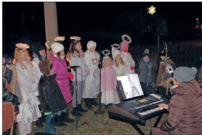
foto a video archiv nejen z této akce najdete na našem Facebooku – stačí zadat do vyhledávače „SDH Hynkov“.

Vážení a milí spoluobčané, rád bych Vám jménem Sboru dobrovolných hasičů Hynkov poděkoval za přízeň, kterou jste nám v končícím roce věnovali, popřál krásné a požehnané prožití vánočních svátků a zejména pak úspěšný vstup do roku nového. Budeme se na vás všechny těšit na našich akcích.