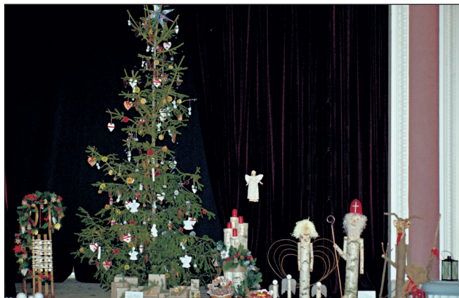
Foto k článku Vánoční vystoupení u rozsvěcování vánočního stromu (str. 2)