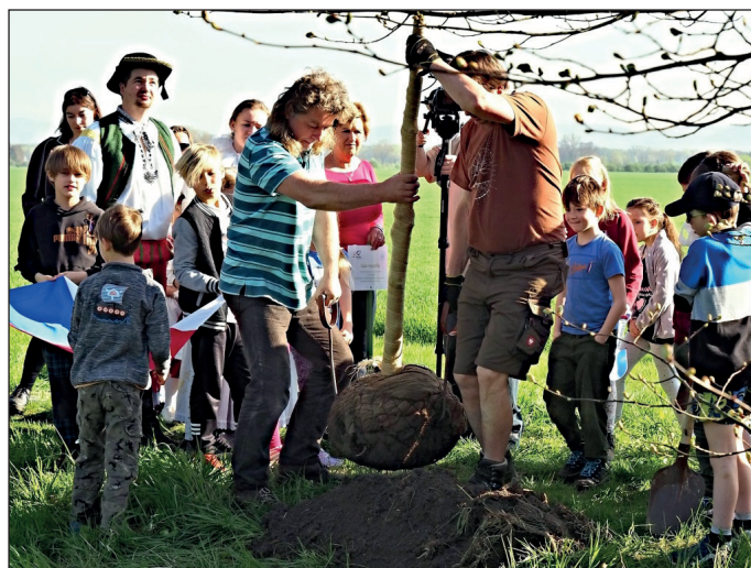
DEN ZEMĚ - výsadba lípy republiky. Žáci ZŠ Příkazy zahájili obnovu lipové aleje k Náklu