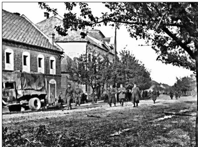
Za tankem postupovala pěchota