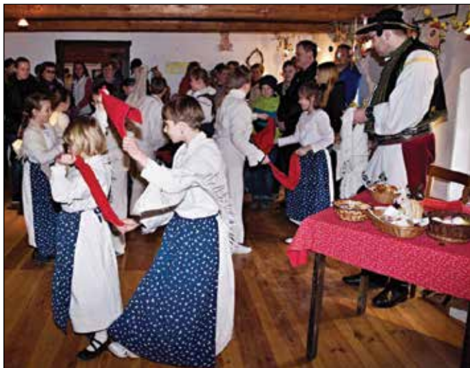
Foto k článku Velikonoce ve skanzenu na str. 7