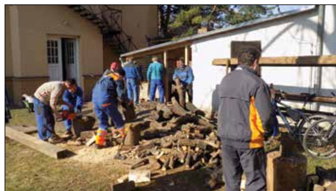
Foto k článku Brigády - TJ Sokol Příkazy na str. 9