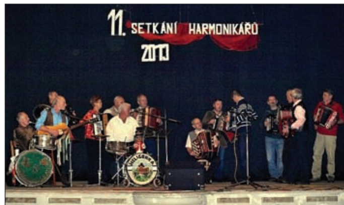
Závěrečné vystoupení harmonikářů

Odpoledne plné hudby a zpěvu každoročně připravují naši harmonikáři spolu se Seniorklubem a kulturní komisí obce Příkazy.