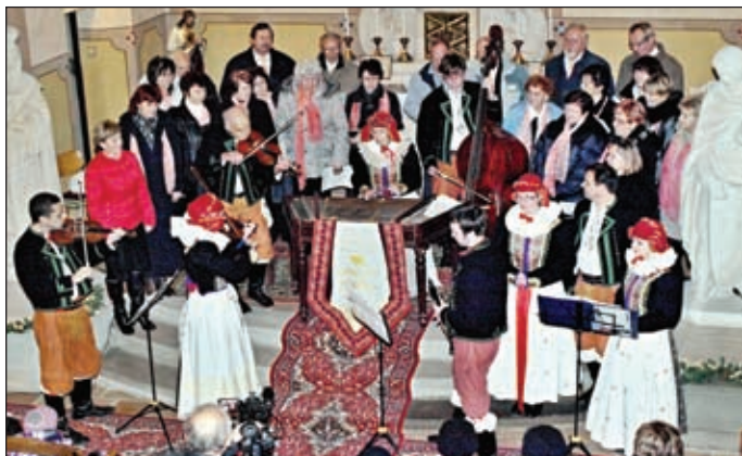
Hanácká mŕžeka z Litovle s pěveckým sborem

Advent v naší obci začal rozžiháním vánočních stromů, v sobotu 30.11. na Hynkově a v neděli 1.12. v Příkazích. Součástí oslavy byl kulturní program, na Hynkově v kulturním domě, v Příkazích v kapli. V něm vystoupil náš Smíšený pěvecký sbor spolu s cimbálovkou z Litovle.