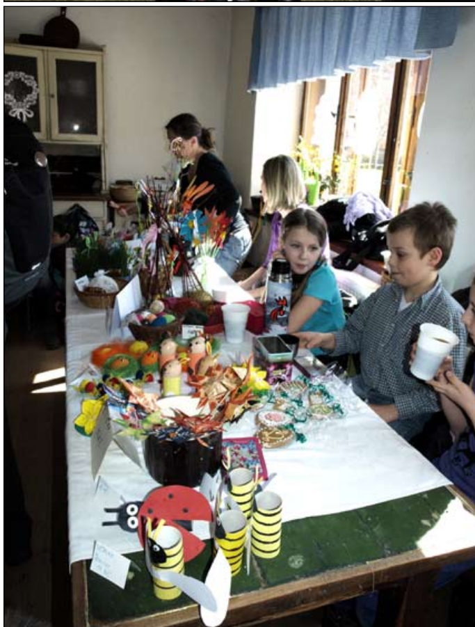
Velikonoce ve skanzenu