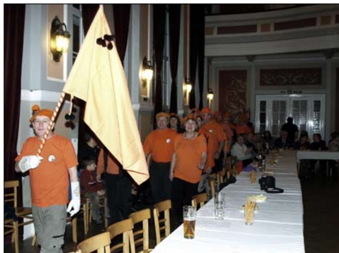
Slavnostní nástup SDU při zahájení večera.