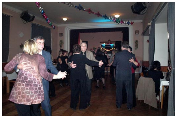
Hasičský ples Hynkov