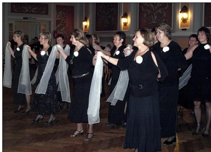
Sokolský ples Příkazy