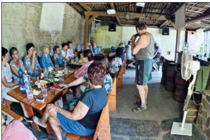
Foto k článku na str. 6 - Prázdniny v seniorklubu