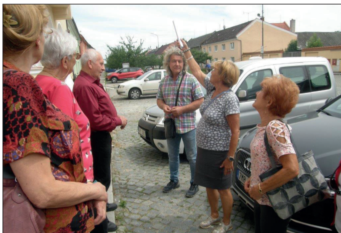
Hosty z Jeseníka přivítal i náš pan starosta