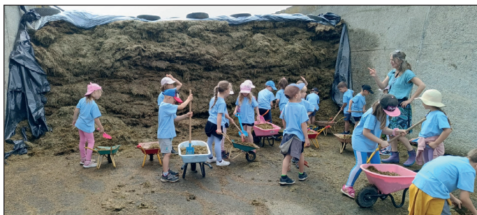
Děti z MŠ na výletě