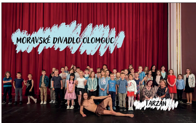
Školáci v divadle