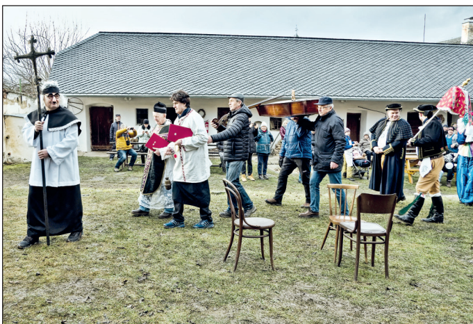
Foto z ostatků